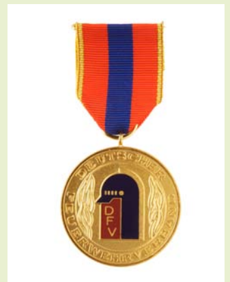
Medaille für internationale Zusammenarbeit, Gold